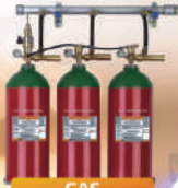
GAS SUPPRESSION SYSTEMS