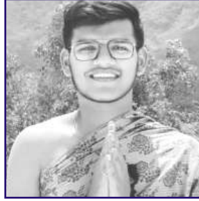
તુમિત ધર્મેન્દ્ર ગોસર બારોઈ (જલગાંવ) અફાઈ