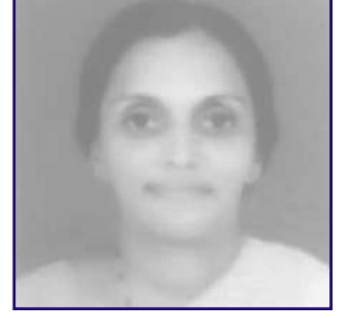
દક્ષા જયેશ લોડાયા સાંયરા (જલગાંવ) અફાઈ