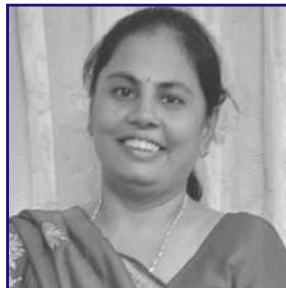
યેતના હિતેશ મોમાયા જખૌ (જલગાંવ) અફાઈ